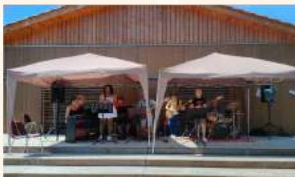
Le groupe Pop-rock

■ Les inscriptions sont déjà ouvertes n'attendez plus ! Pour plus d'informations et/ou trouver le formulaire d'inscription : asso-edmpierresdorees@laposte.net ou http://asso-edmpierresdor.wixsite.com/