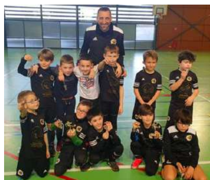
les U9 avec leurs trophées lors d'un tournoi

Le printemps est synonyme de grande activité au SAF, les championnats sont dans leur deuxième moitié de saison et les tournois de printemps et d'été sont tous en programmation.